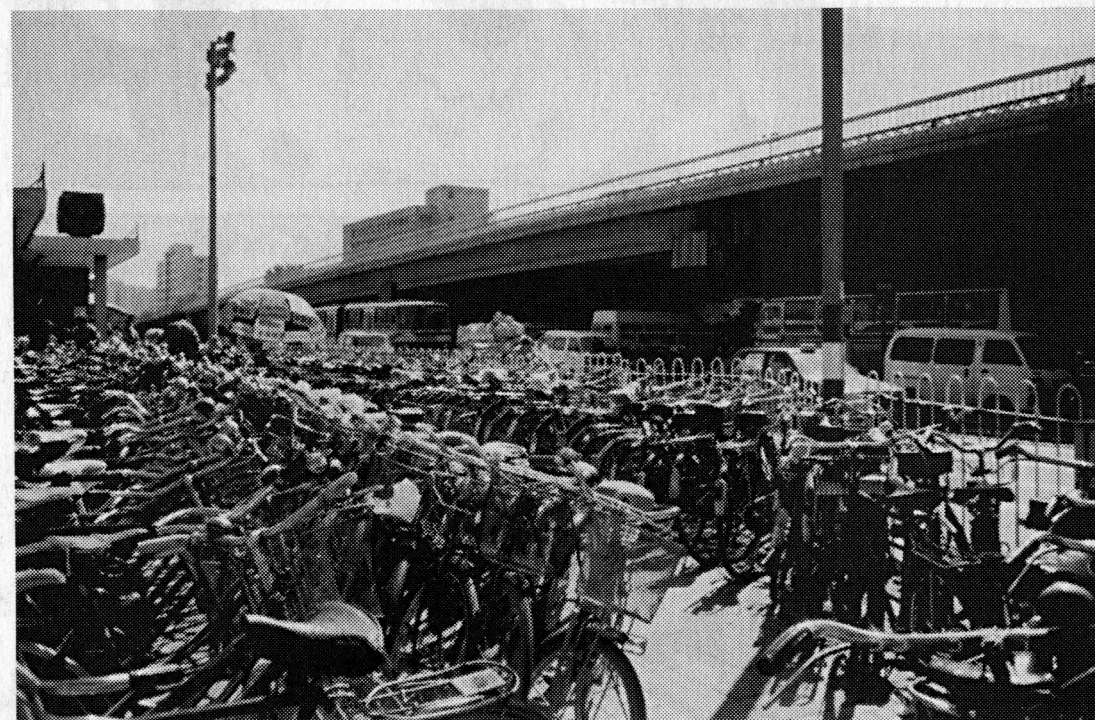
Tuhanded rattad ootamas tööpäeva lõppu Pekingis ühe metroojaama sissekäigu juures: siis tuleb peremees(naine) ja sõidetakse koju. Rattad näevad reeglina välja nii, et lukustada neid pole mõtet.

Tundub, et ikkagi on põhjust neid pidada.